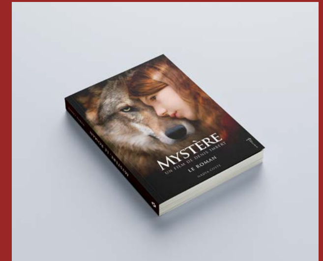
Mystère, Le roman, Nadia Coste, La Martinière Jeunesse, 2020