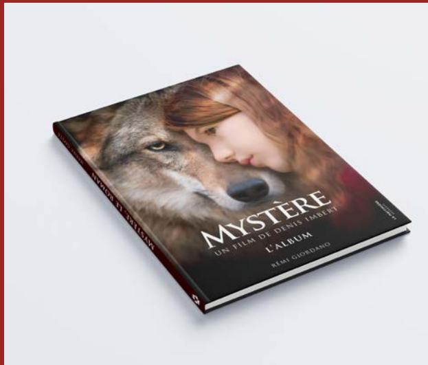
Mystère, L'Album, Rémi Giordano La Martinière Jeunesse, 2020